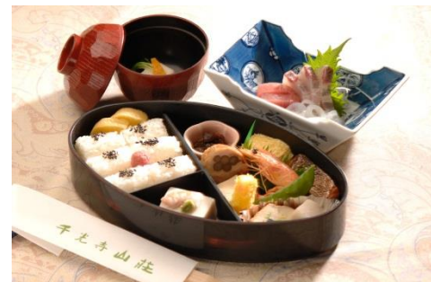
旬の造り付、会席弁当