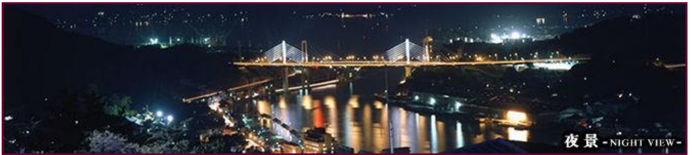
夜景 - NIGHT VIEW -

観光旅館千光寺山荘（せんこうじさんそう）は広島県尾道市の高台千光寺公園近傍に位置し、すべての客室で景色を楽しめる宿泊施設です。当館は「景色と食事と地酒を楽しんでいただき、町めぐりの拠点として、尾道に来られた観光客の期待に応えられる旅館サービスに勤めております。しまなみ海道方面、山陰方面へのご旅行のお立ち寄りに、歴史と文学の街尾道のご旅行にご利用ください。