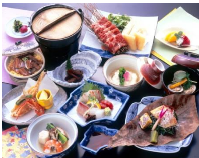
名物大宝山鍋、旬の造り他 13品、季節の会席料理例