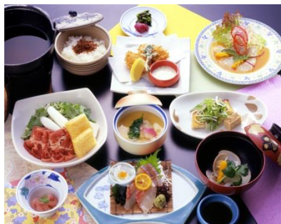
名物大宝山鍋、旬の造り他 10品、季節の会席料理例